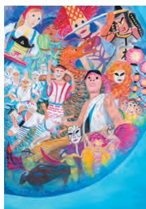
Nishimura Waka · 14 anos, Japão