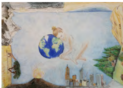
Lara Hine Chinita 13 anos, Portugal