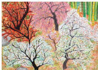
Haneji Yuka 13 anos, Japão