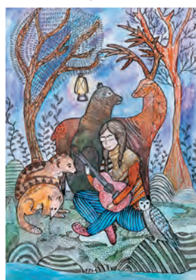
Alina Tatarova · 13 anos, Ucrânia