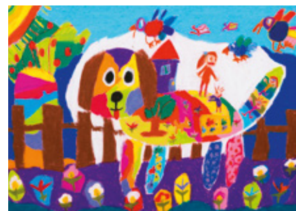
Cetin Nazlican, 11 anos, Turquia