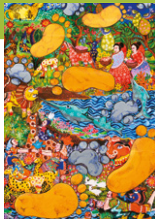
Urvi Jain, 14 anos, Índia