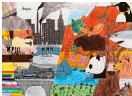
Beatriz Guilherme, 14 anos, Portugal